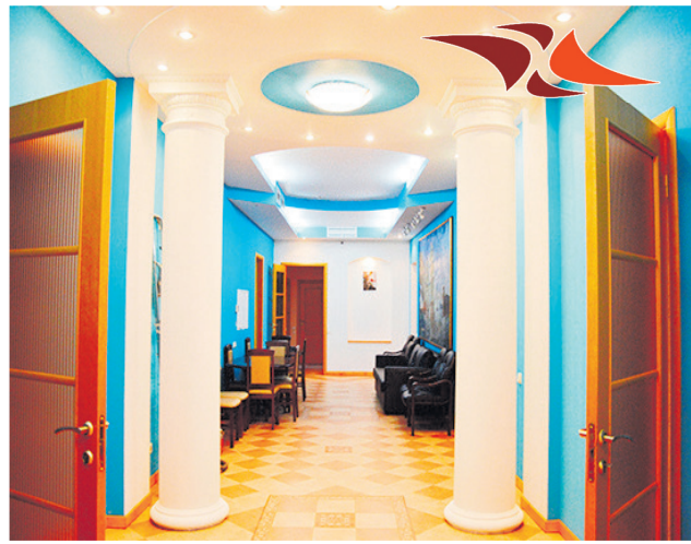
Сеть пансионатов «Элегия»:

В «Элегии» понимают, насколько важно для взрослых детей быть уверенным в том, что для их постаревших родных делается все возможное, что они находятся в безопасности под неусыпным присмотром внимательных и опытных профессионалов. Сотрудники сети пансионатов «Элегия» на Ждановской улице, делают это максимально грамотно и с любовью.